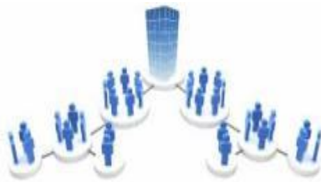
Сл. 3 Символика на организација на МЗ