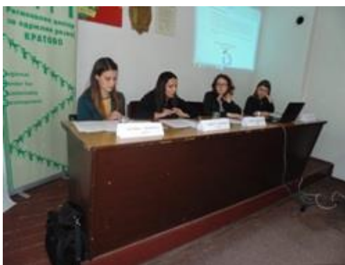
Сл.1 Од трибината за промоција на проектните резултати