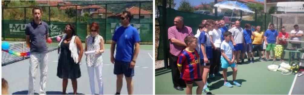
Сл.2 Настан за донација на спортска опрема на Тенискиоти Клуб од Кратово