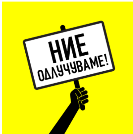
Сл.5 Официјално лого на кампањата