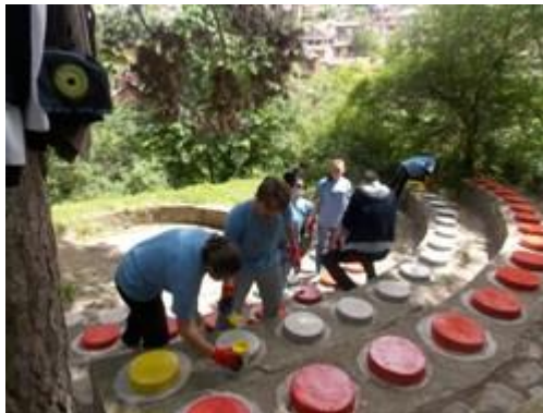
Сл.6 Уредување на локалитетот Карши Бавча