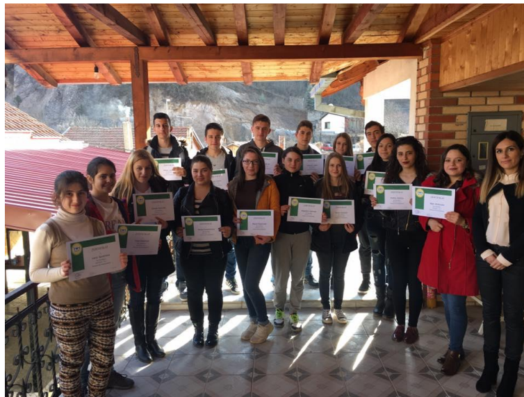
Сл. 7 Дел од посетителите на курсеот по германски јазик