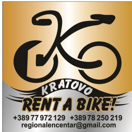
Сл. 4 Промотивен постер

Паралелно на овие активности ќе имаме и интензивна медиумска кампања на локални, регионални и национални печатени и електронски медиуми со тенденција да се оформи специјализиран сајт за оваа намена www.osogovobiketurizm.mk Понудите кои ќе бидат креирани освен преку медиумска афирмација, ќе бидат доставени до поголемите туристички агенции во државата и регионот и ќе бидат направени линкови со сродни организации на Балканот. За нив ќе се подготват и 3 соодветни промотивни материјали со мапи и водичи на македонски и англиски јазик. За таа цел во различни фази од имплементација на проектот ќе се врши медиумска промоција со тематски изјави, прес конференции или соопштенија, кои ќе ја следат динамиката на имплементацијата на проектните активности.